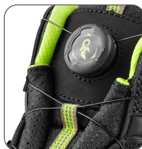
speciální utahovací systém špeciálny systém utahovania special fastening system specjalny system zapinania