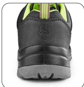
odolná pätní část odolná päťová časť resistant heel part wytrzymała część pięty