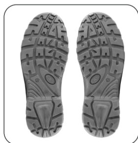
podešev podošva outsole podeszwa