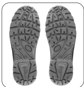
podešev podošva outsole podeszwa